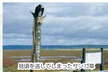
見頃を逃してしまったサンゴ草

並べてある売店を見て、改築されて間もない綺麗なオホーツク流水館へ向かいます。建物の中には今年の流水が展示してあり、中の温度は-20℃に保たれていると言うことで、まだ寒さに慣れていない身には足下からの冷え込みを感じました。大画面で映される映像に車酔い状態になった人もいたようです。お土産を買い、中標津へ向かいます。途中、清里町の道の駅で休憩、その後清里峠を越え、牛文字が見える養老牛のモアン山を眺め、全員無事に中標津へ到着しました。参加されたみなさん、ご苦労様でした。また次の旅行の参加をお待ちしております。