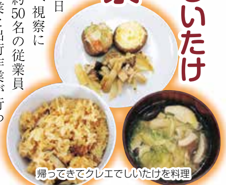
帰ってきてクレエでしいたけを料理

10月19日、部会員10名で俵橋にある「想いの茸」を生産している(株)翔の中標津しいたけ生産センターへ視察に行ってきました。この施設では、約50名の従業員が働いており、視察した日は収穫作業と出荷作業が行われていました。ここではおが屑と栄養源をビニール袋に入れて固めた「菌床栽培」を行っており、ハウス内の棚には沢山のビニール袋が並んでいます。これが、3ヶ月後にはしいたけが収穫出来る状態になるそうです。出荷作業を行っている建物では衛生に配慮した格好で、しいたけを丁寧に並べ、エアを吹きかけてからラップする作業を数名の従業員で行っていました。また同施設内では、パック詰め・袋詰めされたしいたけを販売しており、視察した部会員は自宅用にと沢山購入していました。視察後、各自クレエに集合し昼食は購入してきた、しいたけをふんだんに使った料理を作って食べ、解散しました。