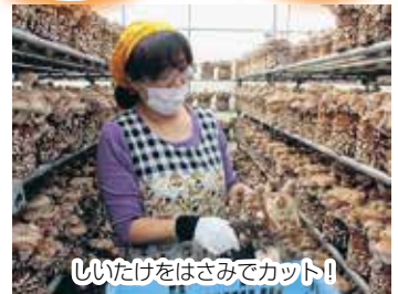
しいたけをはさみでカット!