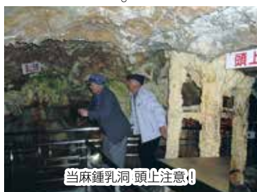
当麻鍾乳洞 頭上注意!

道路は夏タイヤでも走れそうです。途中、大函に寄る予定でしたが、台風の影響で閉鎖されていたため、銀河の滝・流星の滝を見ました。石北峠を越えて標高が下がると周りの雪も消え、道路も乾いて走りやすくなり、次の予定地、能取湖へ向かいます。北見市を過ぎて能取湖に着くと残念ながら目的のサンゴ草は見頃を過ぎ、すっかり枯れ草状態でした。早々に能取湖を出発して、網走刑務所の向かいで昼食を取り、網走刑務所を見学(外側だけです)。受刑者の作品が