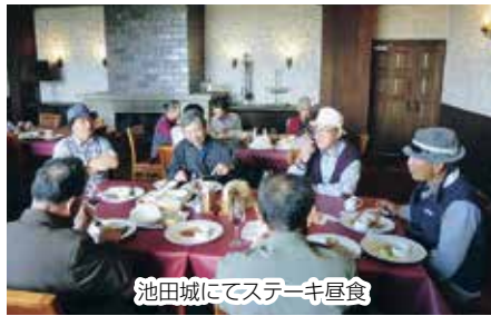
池田城にてステーキ昼食

い人もいたのでは？ ワイン城を出発して帯広市のふるさと村に寄った後、芽室町の明治十勝チーズ工場へ向かいま