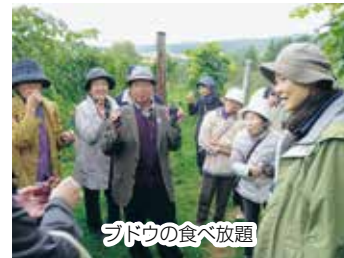
ブドウの食べ放題

いよいよ最終日の朝、外を見るとなんと雪景色です。朝食を済ませて出発。バスのタイヤは夏用でしたが、