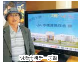
明治十勝チーズ館

でした。工場見学後は今夜の宿泊地の然別温泉へ。今日一日、移動途中でバスの車内から川を見ると、流木や砂利が流された無残な河川敷や、水が流れたであろう畑がほうほうにあり、台風の被害が見受けられました。類や製造工程の違いなどの説明を受け工場の中へ。稼働中の工場の中は誰もいなくて複雑な機械があるだけ