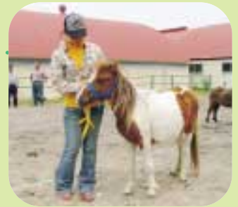
三つ編みしておめかしで参加