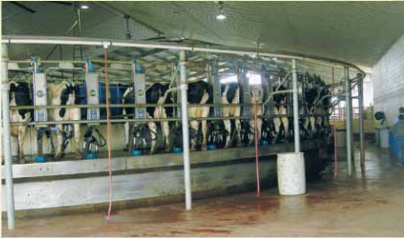
80ポイントロータリーパーラー

牧草収穫は、3〜10月までに6回収穫。草丈は40センチで収穫するからです。牧草はライグラス主体が1100エーカー(440ヘクタール)・コーンが1000エーカー(40ヘクタール)全部で、1200エーカー(480ヘクタール)の農地で経営していました。 バンガーは幅18.2m、長さ97.5m、高さ4.2mのバンガー3本と、幅10.6m、長さ60.9m、高さ4.2mのバンガーが3本の計6