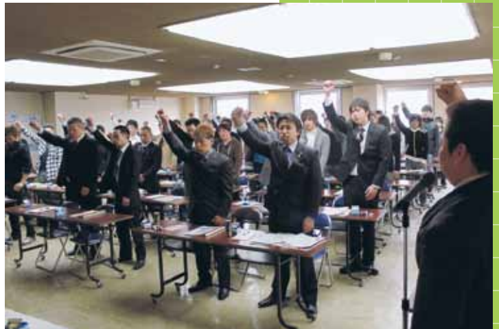
第63回 青年部通常総会 (2011.4.12)