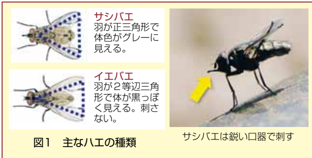
図1 主なハエの種類

特にサシバエは、ストレスや痛みの原因になるばかりか、牛白血病やサルモネラ症などの感染症を媒介することも知られています。発生が本格化する前に対策が必要です。