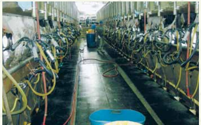
30頭ダブルパーラー

し洗浄水は循環利用をしています。洗浄水の一部はセパレーターで固液分離され、固は牛床で再利用をしています。