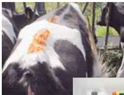
図4 はがれ落ちることで マウンティング行動が あった目安となる （テールペイント）