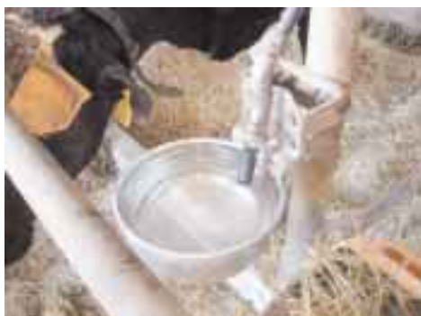
図2 清潔に保たれた ウォーターカップ

来年の経営に直結する繁殖管理ですので、普段の観察よりも少し多めの意識と時間をかけ、発情発見に取り組みましょう。