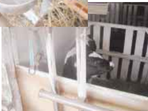
図3 子牛が触れる部分に 石灰塗布（子牛のペン）