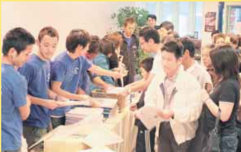
めざせ!牛乳・乳製品消費日本一の町! チャリティ北都プロレス大会(2009.8.4)