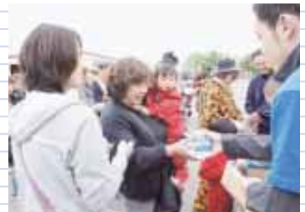
2度来場者に振る舞った中標津牛乳・中標津珈琲