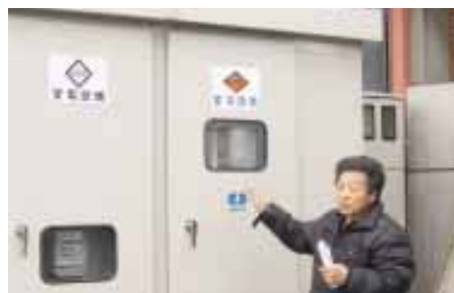
バイオガス売電の供給状況を説明

6部門(給餌・ベットメイキング・哺育・病畜人工・水槽管理)を設けているとの事でした。規模拡大を行った上で必要となる「労働力」、それを補うために農場に入れる「雇用」。