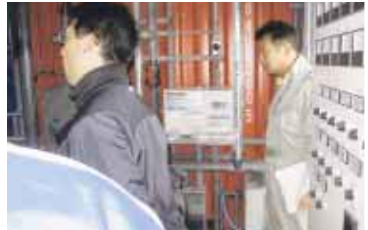
バイオガス施設のメンテナンスは個人で行っている模様

構内舗装・芝生造成の実施、 農場の出入口3カ所（生活専 用・乳牛搬出用、粗飼料・糞 尿搬出用）の設置、電線類の 地下埋設など、安全性・経済 性・省力性を重視し、規模拡 大に備えた農場レイアウトが しつかりと構想・実践されて いる農場でした。