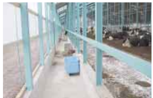
清潔さが大事、清掃状況で個体乳量1(kg/日)差が付くとの話です

自家産の牡仔牛・F1は肉牛部門にて肥育出荷、雌牛については鹿追町の預託施設に預けるなど、分業化が良く進んでいる農場で、従業員の労務分担についても搾乳以外で