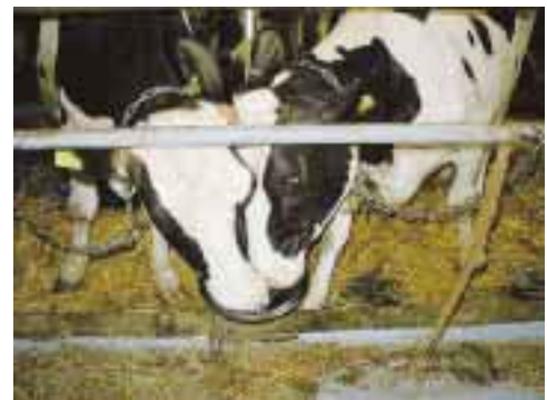
写真3 断水中の争い

(ADAS原図 DairyScienceUpdate1998/169より重引して加筆)