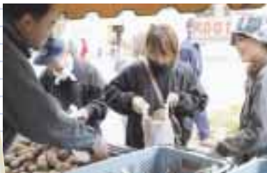
じゃがいも詰め放題