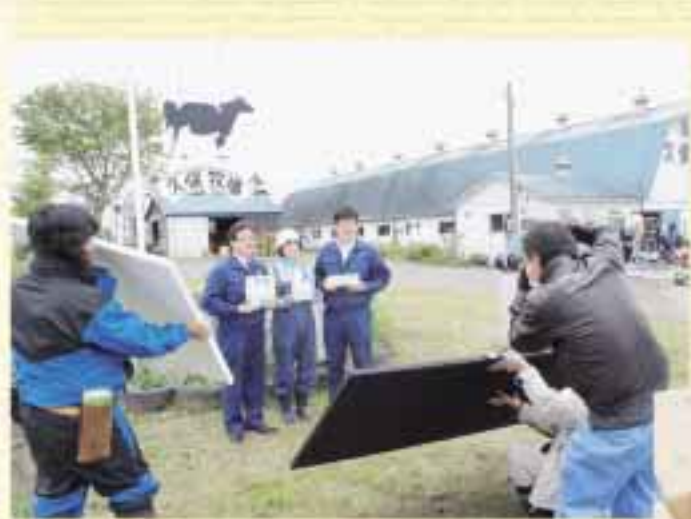
久保美恵子夫人と生産部長瀧部部長、酪農課服部主任は、助監督たちプロスタッフによるスチール撮影、松竹さんの同映画公式Webにて紹介される予定です。