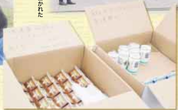
スタッフに差し入れされた中標津牛乳・ケフィアオーレ・中標津珈琲