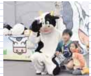
青年部新テント初披露 牛さんとポーズ