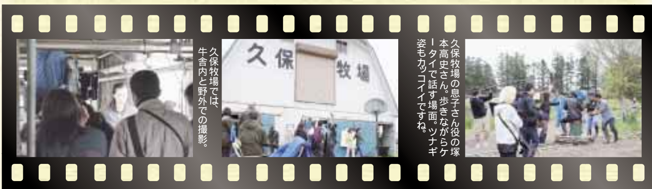
久保牧場では、牛舎内と野外での撮影。