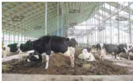
1群65頭を目安に群分け。牛体が清潔でゆったり!!

在飼養頭数で経産牛581頭、育成牛168頭、平成20年度の出荷乳量5,500t、個体乳量平均33・3kg/日。飼養管理はフリーバーン施設で4棟の牛舎(肉牛用施設)の形をした、敷料には戻し堆肥(水分調節後、乾燥施設へ搬入)を利用。乳牛・肉牛ともに2、3回戻し敷料を利用後、堆肥化を行い、畑に還元する形を取っているようです。