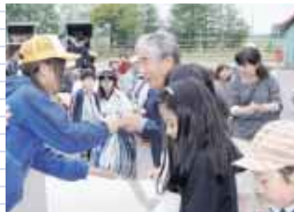
スタンプラリー抽選会