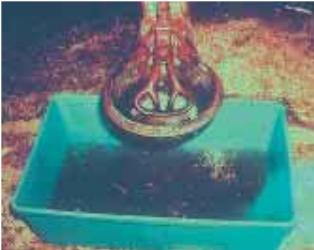
写真2 洗浄後の洗浄水

写真1のようには足りませんが、牛は大量の水を必要とします。タイストール牛舎の場合、牛舎内の横配管を直径3～4インチにループで配管すると1頭当たり5～10ℓの貯水効果があります。