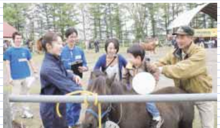
青年部企画 牛博士と廻る共進会ツアーにて、馬に乗せてもらったの◎