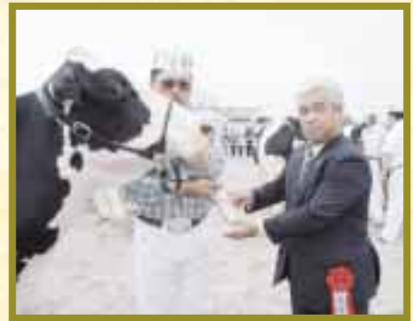
グランドチャンピオン サニーデール リー スター号