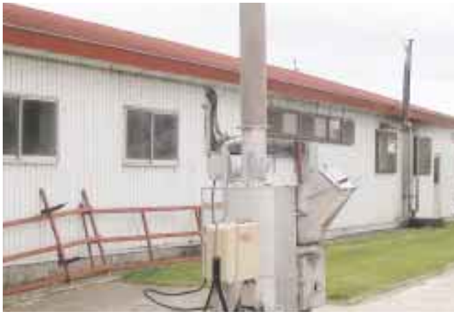
ダイオキシンの無発生焼却炉...価格は100万円程

の正道氏が経営されておりま す。 農地面積は借地を含む65 haで、デントコーン・牧草 を収穫。労働力は家族4名と 2名の雇用者。飼養頭数35 0頭（成牛200頭、育成牛 150頭）で、昨年出荷乳量 は1,800tの大型経営と なっております。 経営のポリシーが「経営改 善は環境改善から」と言う事 から、フリーストール（S 57年）・MP（H元年）・コ ンピューターフィードシステ ム（S56年）などの近代化