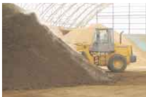
切り返しは従業員の日中作業となっています

6部門(給餌・ベットメイキング・哺育・病畜人工・水槽管理)を設けているとの事でした。規模拡大を行った上で必要となる「労働力」、それを補うために農場に入れる「雇用」。