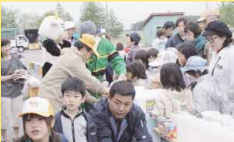
JA中標津総合共進会&牛まつり(2009.6.6)