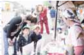
女性部の出店 おいしいヨ。