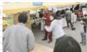
牛肉ゲットダーツ 高額部位に当たるかな？