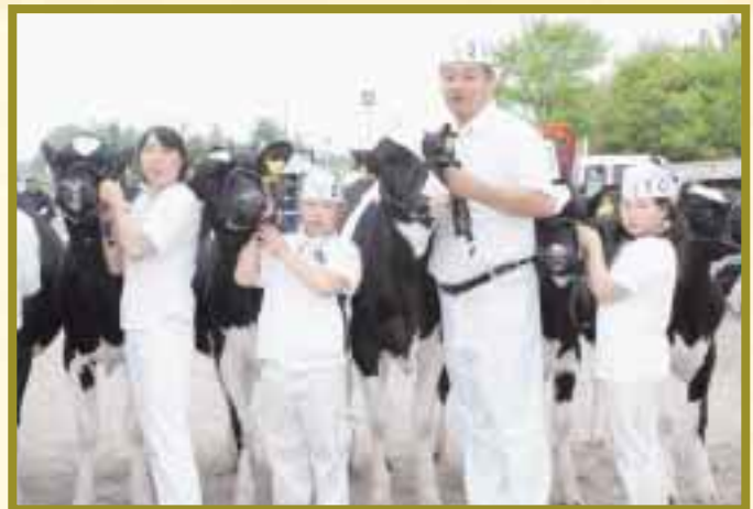
家族揃ってリードする中川家のみなさん