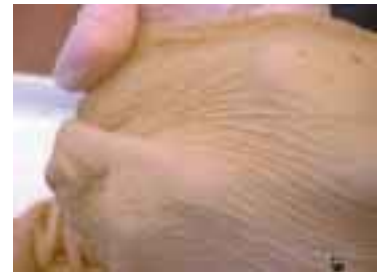
図3 12週齢子牛の未発達した絨毛 (ミルク+乾草)