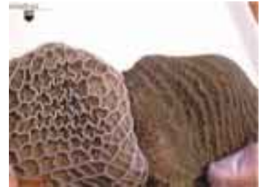
図2 4週齢子牛の発達した絨毛 (ミルク+スターター)

また乾草などの粗飼料を食べることにより、胃壁に「物理的刺激」が与えられ、胃の容積拡大に貢献します。