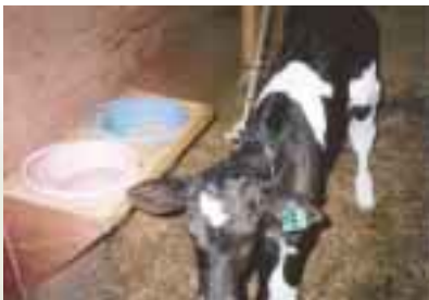
図4 固形飼料と水はセットで給与

早いうちから少しずつ慣れさせて、なるべく早く (2週齢以内) 食い込めるようにします。すると第1胃の絨毛の発達が促され、吸収能の高い胃が形成されます。3日連続で1kg / 日以上程度食い込めるようになったら、離乳の目安です。