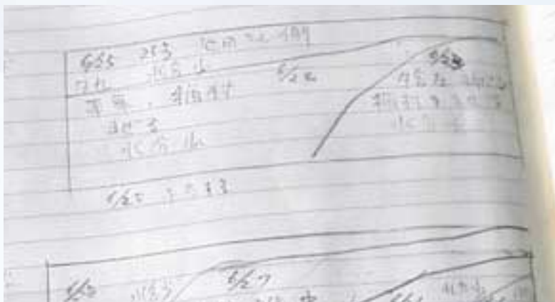
写真1 ノートに整理された貯蔵位置

給与計画の判断材料とします。収穫時期や植生（マメ科率・雑草）水分や降雨などの情報を記録しておくことが大切です。 ロールサイレージでは収穫日やほ場番号をスプレーで記録します。切断サイレージは、写真1の様に貯蔵位置図を作ることによって、1本のサイロの中でもサイレージの質の変化が予測できます。 ノート等に整理し、給与計画を作ることが有益です。