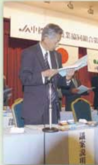
議事説明する乾参事