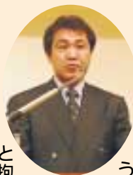
と抱負を語りました。

う優良基礎雌牛の選定と保留に努めて、更なる和牛振興を進めて行きたい」と抱負を語りました。